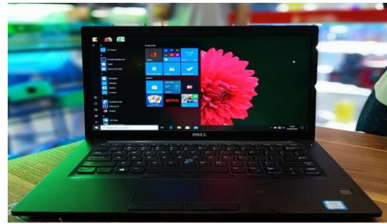
Gambar 1. Penerapan sistem dengan menggunakan laptop untuk interkoneksi dengan internet

Pada tahapan kedua, diperlukan persiapan untuk memeriksa setiap aplikasi yang sudah diimplementasikan sebelumnya, agar dapat memiliki interkoneksi dengan data yang diperlukan dengan melalui jaringan internet. Tahapan ini juga mempertimbangkan bahwa setiap aplikasi harus diupdate agar aplikasi tersebut memiliki tingkat keamanan yang baik dalam keterhubungannya dengan internet. Kedua tahapan ini dapat digambarkan sebagai berikut: