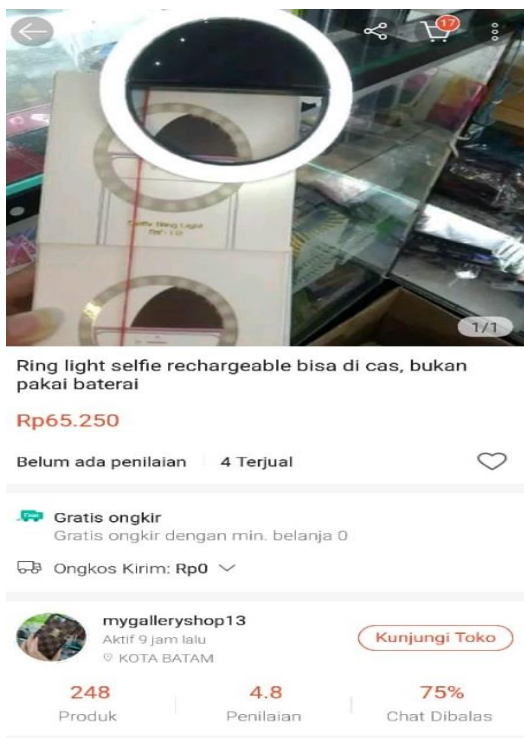
Gambar 4. Postingan produk my gallery