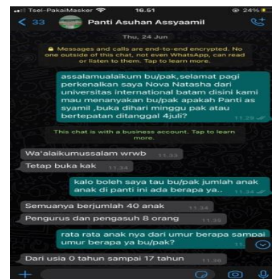
Gambar 2. Wawancara online bersama Pemilik Pantu Asuhan Assyaamil