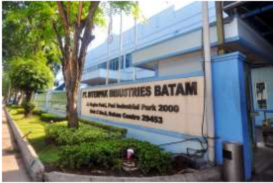
Gambar 1. Tampak Depan Perusahaan PT Interpak Industries Batam