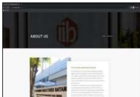
Gambar 3. Tampilan About Us

Pada page ini berisi informasi lengkap mengenai mitra berupa latar belakang mitra, mesin yang dimiliki, informasi gudang, dan juga quality assurance dari mitra.