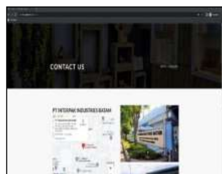
Gambar 6. Tampilan Contact

Pada page contact berisi detail alamat dan nomor telepon serta email mitra.