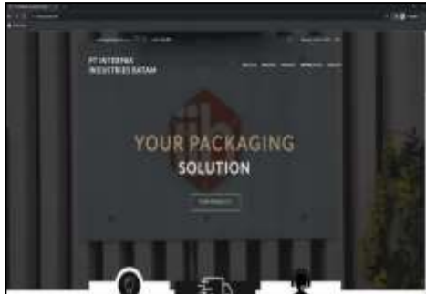
Gambar 2. Tampilan Homepage

Pada tampilan homepage ini, berisi navigation bar yang berisi page-page yang tersedia pada website ini. Page homepage ini berisi informasi berupa services dari mitra dan juga tampilan produk mitra.