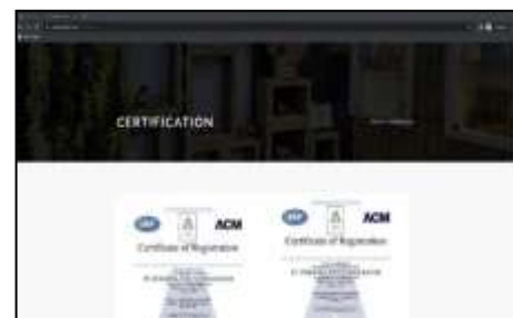
Gambar 5. Tampilan Certification

Pada page certification berisi sertifikat yang telah diperoleh mitra.