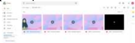
Gambar 1. 10 Unggahan Video Pembelajaran di Google Drive

kelas saat proses pembelajaran. Berikut lampiran implementasi luaran: