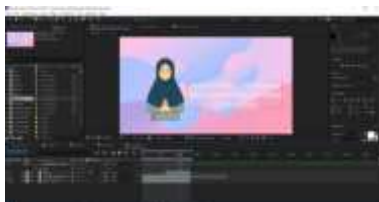
Gambar 1. 7 Proses perancangan penutupan video

Video yang sudah selesai di upload ke google drive dan dikirimkan kepada mitra untuk di review pada tanggal 30 Juni 2022. Pada tanggal 1 Juli 2022 mitra memberikan tanggapan bahwasannya ada beberapa pengucapan yang kurang tepat. Yaitu pada video pembelajaran bab 5 dengan pengucapan yang kurang tepat saat pengucapan “utsmani” yang seharusnya “usmani”, dan saat pengucapan “Sultan Malik Al-Saleh” yang seharusnya “Sultan Malik As-Saleh”. Penulis melakukan revisi dengan merekam ulang suara khusus di dua kata tersebut. Dan melakukan editing untuk memasukan suara dari pengucapan yang sudah tepat ke dalam project video bab 5. Video yang sudah di revisi dikirim kembali kepada mitra pada tanggal 4 Juli 2020 dan sudah diterima dan disetujui oleh mitra pada tanggal 5 Juli 2020. Berikut lampiran kegiatan revisi: