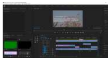
Gambar 1. 9 Proses revisi video

Video pembelajaran yang sudah selesai dirancang dan sudah dilakukan penilaian oleh mitra terhadap kelengkapan materi dan kesesuaian video pembelajaran dengan referensi yang diberikan. Video pembelajaran di unggah ke google drive dan youtube. Link dari google drive dan youtube diberikan kepada mitra sehingga mitra bisa mengunduh video pembelajaran tersebut. Video pembelajaran akan digunakan pada semester yang akan datang dengan membagikan video kepada siswa untuk dijadikan referensi atau dengan memutar video pembelajaran didalam