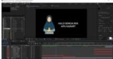
Gambar 1. 5 Proses perancangan pembukaan video

Setelah itu, perancangan video dilakukan menggunakan software Adobe Premiere Pro CC 2018 dan Adobe After Effect CC 2020. Proses animasi text dilakukan di Adobe After Effect CC 2020. Pada proses ini dilakukan perancangan pembukaan dan penutupan yang akan digunakan pada setiap video. Proses perancangan isi/materi dilakukan di Adobe Premiere Pro CC 2018. Pada proses ini juga dilakukan input suara yang menjadi patokan dari text materi pada video tersebut. Berikut merupakan proses perancangan video: