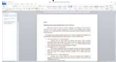
Gambar 1. 4 Naskah video pembelajaran bab v

Rangkuman dari 5 bab tersebut dijadikan 5 naskah untuk dinarasikan. Dengan naskah tersebut, dilakukan perekaman narasi dengan pengisian suara oleh Tanty Nur Annisa. Perekaman suara dilakukan dengan menggunakan smartphone dan dikirim kepada penulis melalui google drive. Berikut merupakan contoh naskah: