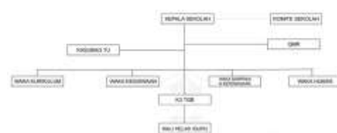
Gambar 1. 1 Struktur Organisasi

SMK Negeri 2 Batam memiliki visi yaitu "Menjadi pusat pendidikan, pelatihan bisnis manajemen dan pariwisata yang memiliki lulusan profesional dan berakhlak mulia serta rujukan bagi institusi