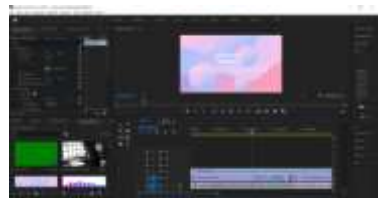
Gambar 1. 6 Proses perancangan materi video