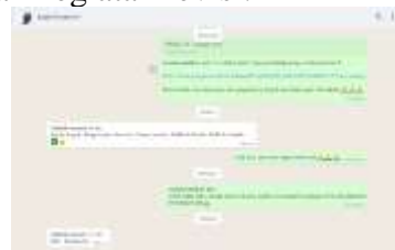
Gambar 1. 8 Proses persetujuan project

Video yang sudah selesai di upload ke google drive dan dikirimkan kepada mitra untuk di review pada tanggal 30 Juni 2022. Pada tanggal 1 Juli 2022 mitra memberikan tanggapan bahwasannya ada beberapa pengucapan yang kurang tepat. Yaitu pada video pembelajaran bab 5 dengan pengucapan yang kurang tepat saat pengucapan “utsmani” yang seharusnya “usmani”, dan saat pengucapan “Sultan Malik Al-Saleh” yang seharusnya “Sultan Malik As-Saleh”. Penulis melakukan revisi dengan merekam ulang suara khusus di dua kata tersebut. Dan melakukan editing untuk memasukan suara dari pengucapan yang sudah tepat ke dalam project video bab 5. Video yang sudah di revisi dikirim kembali kepada mitra pada tanggal 4 Juli 2020 dan sudah diterima dan disetujui oleh mitra pada tanggal 5 Juli 2020. Berikut lampiran kegiatan revisi: