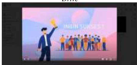
Gambar 1. 11 Unggahan Video Pembelajaran di Google Drive