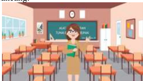
Gambar 4.1 Scene

Video dirancang dengan menggunakan aplikasi after effect , dan aplikasi adobe photoshop untuk mendesain beberapa asset. Berikut adalah tampilan scene dari video pembelajaran Ekonomi yang telah dirancang.