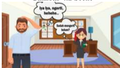
Gambar 4.3 Scene