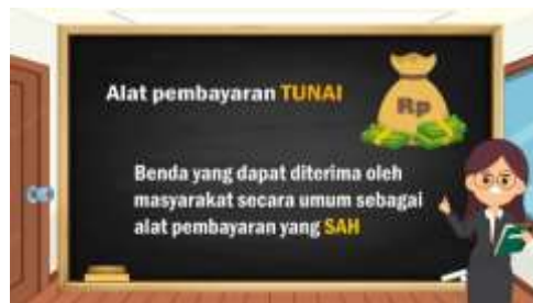
Gambar 4.2 Scene