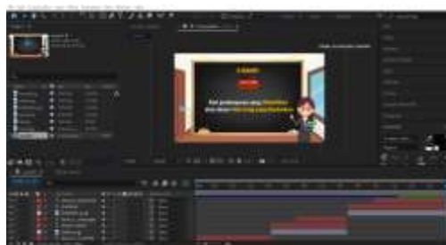
Gambar 4.5 Proses perancangan video