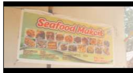
Gambar 9. Spanduk menu khas kuliner Desa Wisata Kampung Terih

Selanjutnya terdapat gambar 9 yang menunjukkan sebuah spanduk yang dimana terdapat menu-menu khas melayu pada Desa Wisata Kampung Terih. Setelah menunjukkan scene menu terdapat transisi zoom in untuk perpindahan scene untuk pengenalan menu khas kuliner pada Desa Wisata Kampung Terih yang dapat dilihat pada gambar 10.