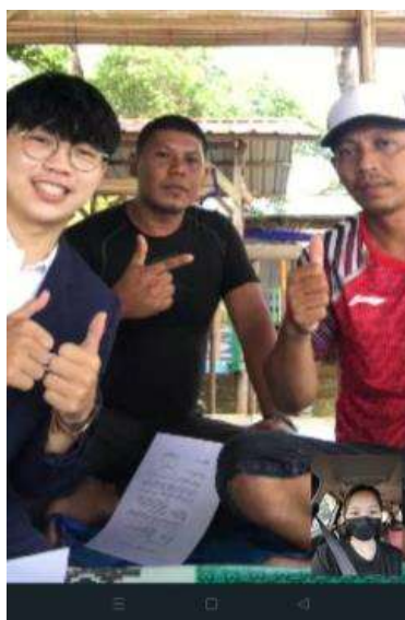
Gambar 19. Dokumentasi foto bersama

Berikut merupakan dokumentasi pertemuan bersama pihak mitra beserta dosen pembimbing dan penyerahan hasil project yang telah selesai dibuat :