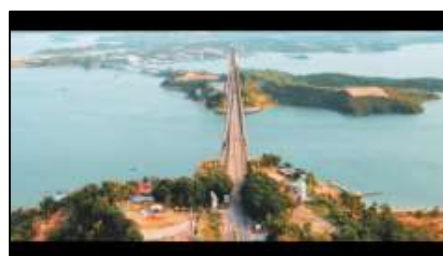
Gambar 4. Intro pada video promosi Desa Wisata Kampung Terih

Hasil dari perancangan luaran kegiatan dalam proyek ini adalah sebuah video promosi mengenai Desa Wisata Kampung Terih sesuai dengan hasil wawancara yang telah dilakukan bersama pihak mitra Desa Wisata Kampung Terih, yang dimana dapat membantu pihak Desa Wisata Kampung Terih menjadi lebih dikenal oleh kalangan masyarakat, baik dari lokal ataupun mancanegara. Video dirancang sesuai dengan storyboard yang telah dibuat dan disepakati bersama pihak mitra. Proses editing pada video dilakukan dengan menggunakan aplikasi Adobe Premiere Pro 2020 , setelah video selesai di edit akan dilakukan tahap pengujian pada video tersebut. Berikut terdapat gambar 4 yang merupakan sebuah intro dari video tersebut yaitu footage drone pada jembatan barelang yang mengarti bahwa wisata yang dipromosi pada video tersebut berada pada Kota Batam dengan tambahan voiceover yang menjelaskan bahwa Kota Batam merupakan provinsi kepulauan Riau yang menjadi sebuah kunjungan wisatawan.