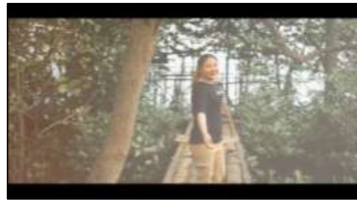
Gambar 8. Area Hutan Mangrove

Selanjutnya terdapat gambar 9 yang menunjukkan sebuah spanduk yang dimana terdapat menu-menu khas melayu pada Desa Wisata Kampung Terih. Setelah menunjukkan scene menu terdapat transisi zoom in untuk perpindahan scene untuk pengenalan menu khas kuliner pada Desa Wisata Kampung Terih yang dapat dilihat pada gambar 10.