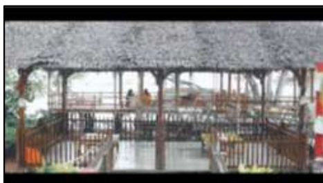
Gambar 7. Pondok pada Desa Wisata Kampung Terih