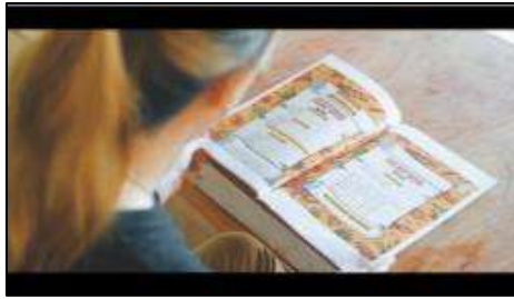
Gambar 11. Scene memilih menu