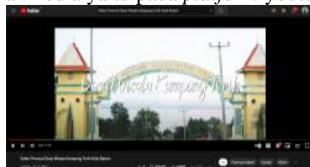
Gambar 3. Publikasi

dosen pembimbing untuk dilakukan validasi pada video tersebut, jika video tersebut sudah validasi oleh dosen pembimbing maka akan dipublikasikan ke sosial media yaitu pada platform youtube.