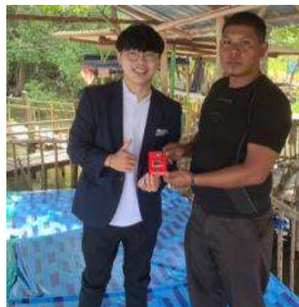
Gambar 20. Penyerahan hasil project dalam bentuk softcopy