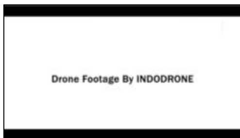
Gambar 18. Teks copyright INDODRONE

Kondisi setelah melakukan tahap implementasi pada sosial media dan video promosi kepada pihak mitra. Hasil yang di dapatkan sangat membantu dan menjadi sebuah solusi pada masalah yang pada pihak mitra yaitu meningkatkan kunjungan wisatawan dan memperkenalkan makanan khas melayu dari Desa Wisata Kampung Terih. Video yang diunggah pada sosial media kini dapat dikenal oleh masyarakat batam ataupun lainnya dan dapat dimanfaatkan sebagai media promosi pada Desa Wisata Kampung Terih.