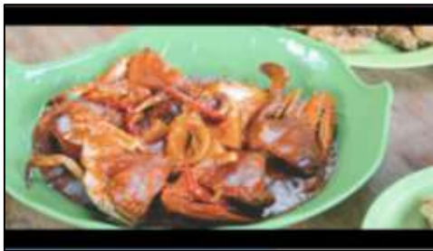
Gambar 12. Menu makanan khas melayu

Selanjutnya pada gambar 13 menunjukkan area untuk bersantai berjalan pada jembatan kayu sambil menikmati pemandangan yang dimana langsung menghadap ke area Batam Center. Selain itu juga terdapat timelapse pemandangan pada gambar 14 dengan view laut yang menghadap area Kota Batam Center yang telah direkam sebagai scene akhir menuju outro pada video tersebut.