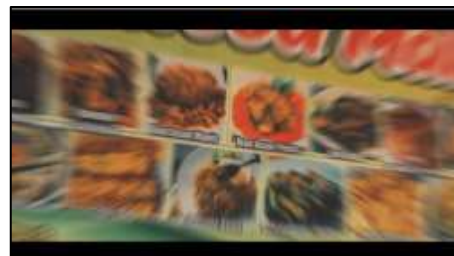
Gambar 10. Transisi zoom in perpindahan scene

Setelah transisi zoom in , pada gambar 11 merupakan perpindahan scene dari sebelumnya yang menunjukkan seorang wanita yang sedang memilih menu makanan. Terdapat juga beberapa scene yang diambil dengan closeup shot pada makanan yang telah disajikan pada gambar 12, disertai juga dengan voiceover .