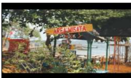
Gambar 6. Papan area wisata

Pada gambar 6 sampai dengan gambar 8 merupakan scene pengenalan fasilitas dan area yang terdapat pada Desa Wisata Kampung Terih, mulai dari papan area yang menunjukkan area-area yang ada di Desa Wisata Kampung Terih, terdapat juga scene pondok-pondok mulai dari ukuran besar hingga ukuran yang kecil dan scene seorang wanita yang sedang berjalan pada area hutan mangrove sambil berputar dengan ekspresi yang senang ditambah dengan efek leak light agar lebih cinematic . Sepanjang video juga terdapat voice over yang dijelaskan sesuai dengan scenenya.