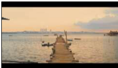
Gambar 13. Area Jembatan untuk bersantai

Selanjutnya pada gambar 13 menunjukkan area untuk bersantai berjalan pada jembatan kayu sambil menikmati pemandangan yang dimana langsung menghadap ke area Batam Center. Selain itu juga terdapat timelapse pemandangan pada gambar 14 dengan view laut yang menghadap area Kota Batam Center yang telah direkam sebagai scene akhir menuju outro pada video tersebut.