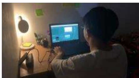
Gambar 2. Proses editing video

Pada tahap assembly adalah tahap pembuatan proyek yang dirancang dan disusun berdasarkan pada storyboard dan akan dilakukan pengeditan video yang menjadi lebih menarik dalam software Adobe Premiere Pro dengan sequence yang digunakan 1920 x 1080 px, codec H.264 dan frame rate 60fps. Video juga ditambahkan beberapa transisi dan audio sebagai sound effect berserta background music .