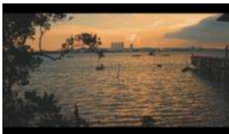
Gambar 14. Timelapse sore hari menuju malam hari

Pada akhir video terdapat sebuah logo Desa Wisata Kampung Terih beserta