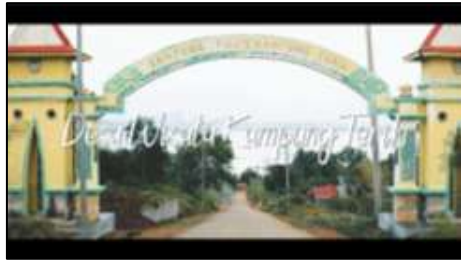
Gambar 5. Gapura menuju Desa Wisata Kampung Terih

Setelah intro video, scene selanjutnya yang terdapat pada gambar 5 merupakan scene gapura menuju Desa Wisata Kampung Terih yang dimana terdapat juga text “Desa Wisata Kampung Terih”.