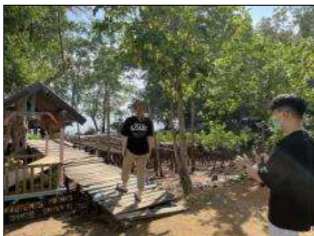
Gambar 1. Proses pengumpulan data