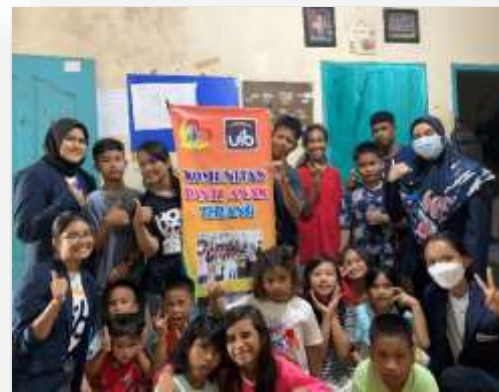
Gambar 7. Pemberian banner