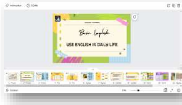
Gambar 2. Modul pelatihan bahasa Inggris