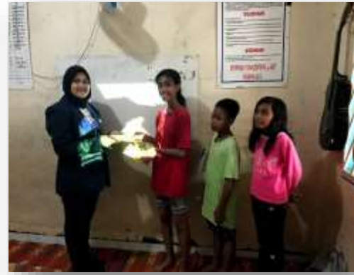
Gambar 6. Pembagian hadiah kuis