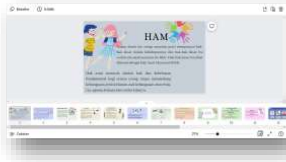
Gambar 1. Modul pelatihan HAM

yaitu modul pelatihan, video presentasi materi, artikel, dan poster. Pada saat selesai menampilkan video materi, kegiatan selanjutnya anak-anak diberikan kuis yang terdapat pada modul pelatihan supaya anak-anak panti dapat mempelajari kosa kata yang baru dan memahami kata-kata yang kurang dimengerti.