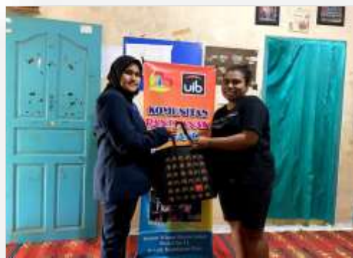
Gambar 8. Pemberian sembako

Keunggulan pengabdian kepada anak-anak panti Asuhan Anak Terang, berupa penyuluhan HAM dan pelatihan bahasa Inggris, yaitu: