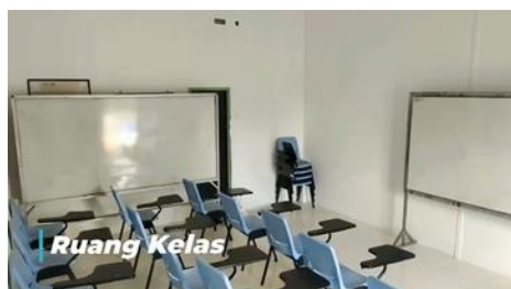
Gambar 4 Fasilitas sekolah