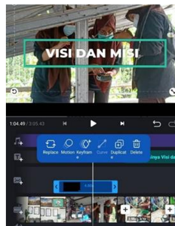
Gambar 2 Proses olah footage