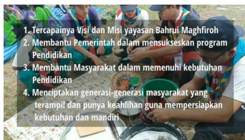
Gambar 5 Visi dan misi sekolah