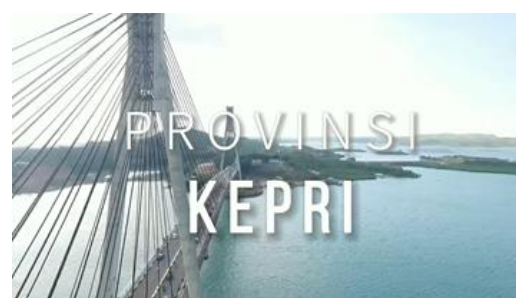
Gambar 3 Pembukaan video

Tampilan awal dari video profil digunakan elemen blackscreen yang kemudian dibuka horizontal secara perlahan mewujudkan suasana Provinsi Kepulauan Riau tepatnya Kota Batam. Selama pengenalan Kota Batam akan ditampilkan scene Jembatan Balerang. Setelah itu memperhalus alur video dengan menampilkan logo identitas sekolah Nizam Al-Mulk yang diberi efek fade in serta lokasi alamat keberadaan gedung barunya.