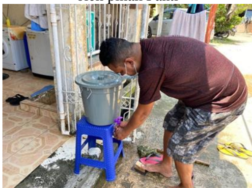
Gambar 7. Penggunaan Alat cuci tangan oleh pihak Panti