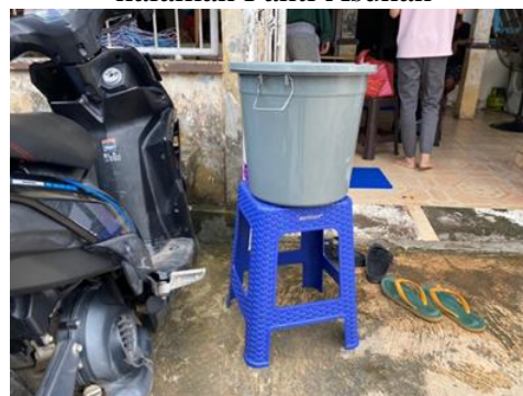
Gambar 6. Pemasangan Alat cuci tangan di halaman Panti Asuhan

mengingatkan kepada mitra UMKM untuk tidak menganggap remeh Gerakan untuk mencegah Covid-19 terutama untuk Panti Asuhan itu sendiri dan bagi pengunjung Panti Asuhan Komunitas Anak Terang. Kegiatan ini juga dipandang baik oleh pihak mitra dan sangat senang menerima alat cuci tangan yang kami berikan sehingga mitra pun tidak perlu membuat alat cuci tangan.