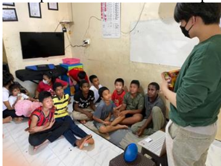
Gambar 5. Pemaparan materi yang disampaikan oleh Ketua kelompok