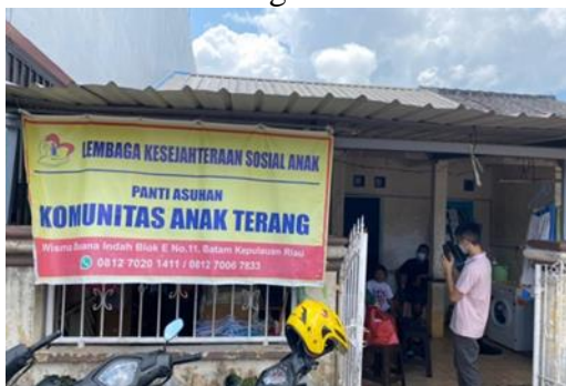
Gambar 4. Halaman Panti Asuhan Anak Terang Batam