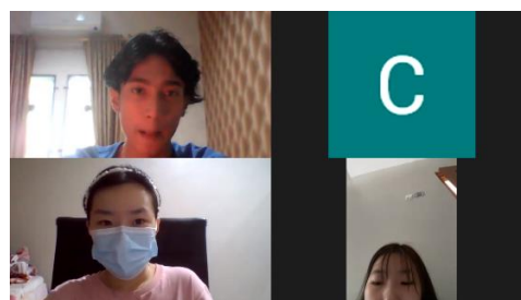
Gambar 2 wawancara dengan pemilik usaha