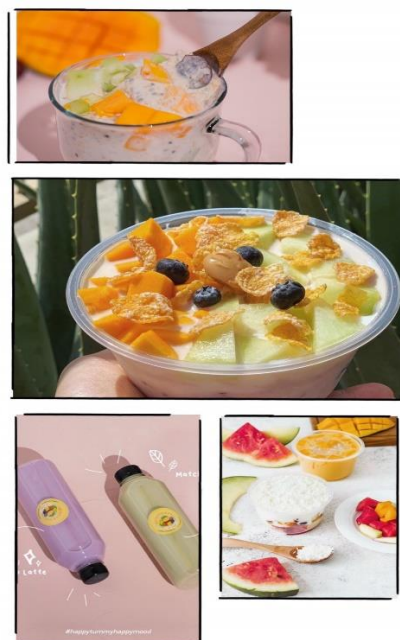
Gambar 4 produk Healthy Box Batam

Foto ini merupakan foto produk dari Healthy Box Batam. Pemilik UMKM tidak setiap hari memproduksi dessertnya, maka dari kenapa saat kita memesan di app gofood ada beberapa produk yang tidak tersedia. Memiliki cita rasa