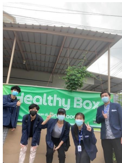
Gambar 1 lokasi produksi UMKM

Pada tanggal 11 Juli 2021, siang hari pukul 11:45 WIB penulis mengunjungi pihak mitra dan melakukan survei pada tempat pengolahan Healthy Box Batam. Penulis menuju tempat pengolahan Healthy Box Batam yang berada di Lucky Estate Nagoya Blok A No 34, Kota Batam. Selain mengumpulkan informasi dari pihak mitra, penulis juga mengecek lokasi dan berfoto untuk dijadikan dokumentasi.