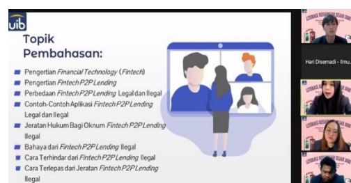
Gambar 2. Materi Pembahasan

Pembahasan yang paling utama yang harus dikedepankan oleh pemateri dan penyelenggara adalah mengenai perbedaan yang perlu diketahui oleh pelajar SMAS