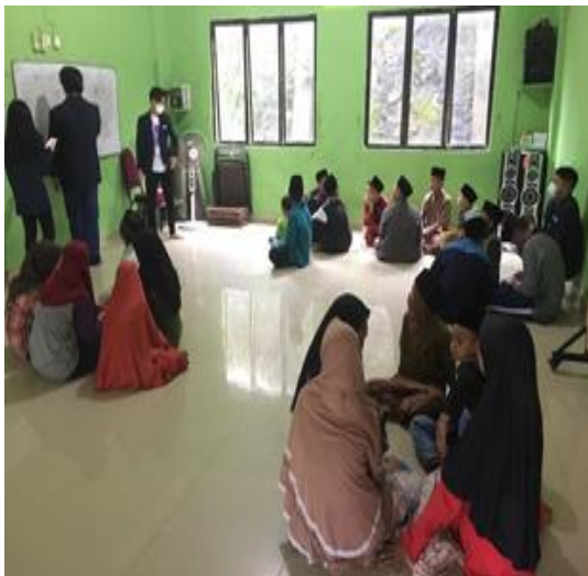
Gambar 3. Kegiatan Kuis